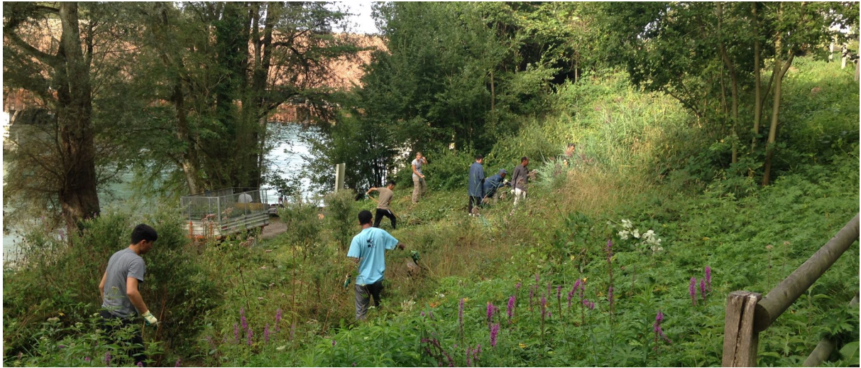
Bild: Freiwilligenarbeit an den Biotopen bei der Neubrücke am 30. August 2017